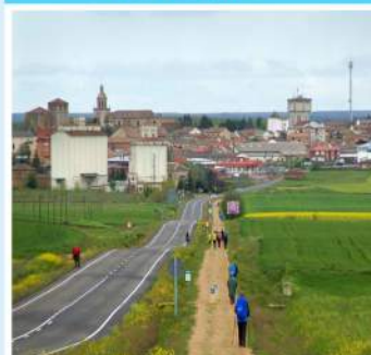
Camino de Santiago