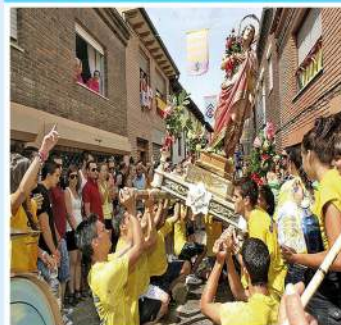
Fiesta de San Zoilo