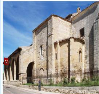
Iglesia de Santa María del Camino