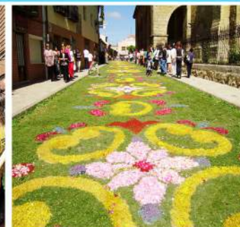
Fiesta del Corpus Cristi