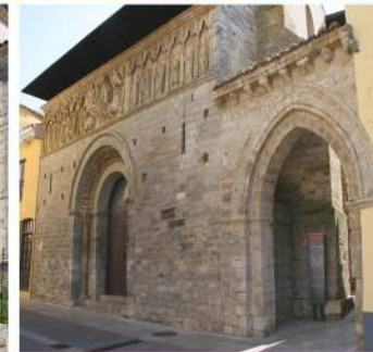
Iglesia de Santiago Apostol