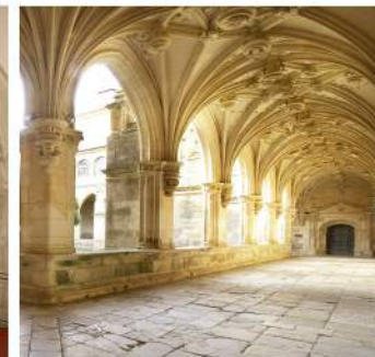
Real Monasterio de San Zoilo